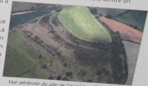
Vue aérienne du site de l'oppidum