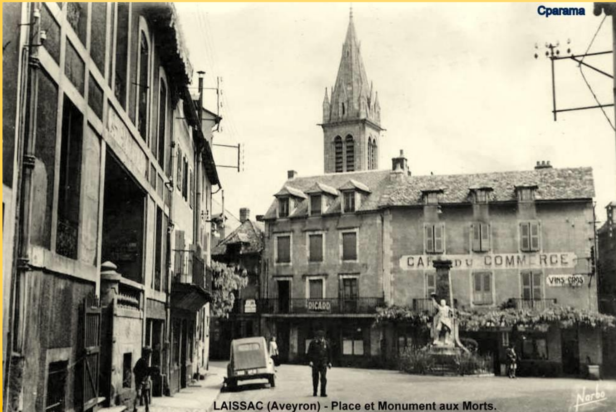
LAISSAC (Aveyron) - Place et Monument aux Morts.