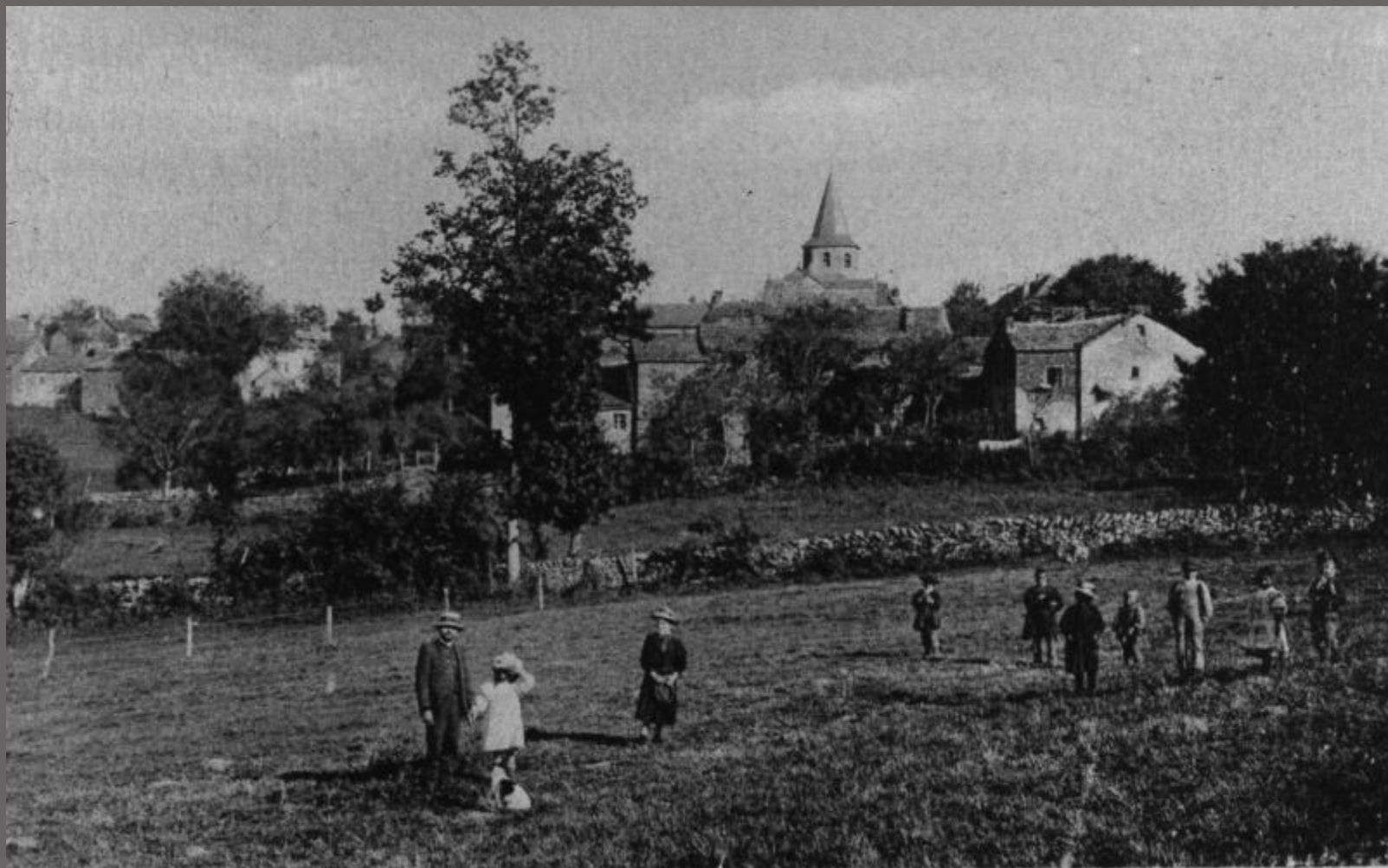
COMPS-la-GRANDVILLE (Aveyron). - Vue générale