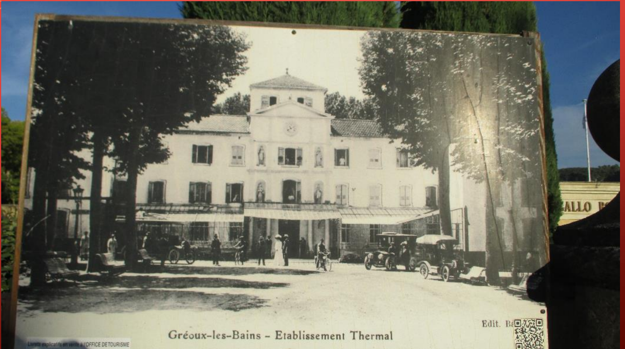
Gréoux-les-Bains - Etablissement Thermal